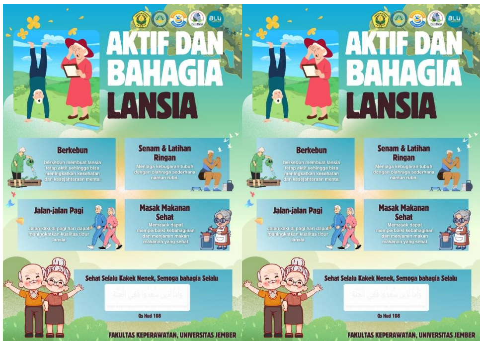
Gambar 2. Leaflet Kegiatan Pengabdian Masyarakat