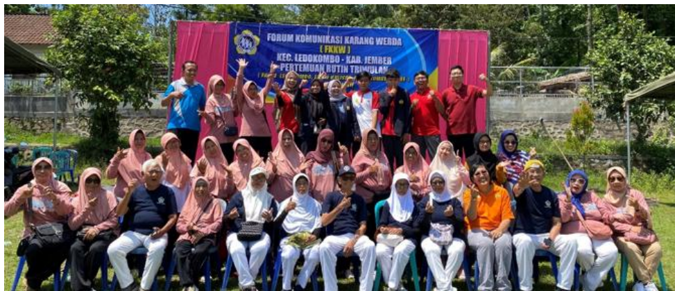
Gambar 4. Foto Bersama Kegiatan Pengabdian Masyarakat

Meningkatkan kualitas hidup lansia agar tetap bahagia di masa tua dapat dicapai melalui pemberdayaan yang menumbuhkan semangat dan dukungan emosional. Dengan adanya dukungan jaringan dan apresiasi sosial, lansia merasa lebih dihargai dan termotivasi untuk menjaga kesehatan, termasuk melalui deteksi dini penyakit demi menekan angka kesakitan. Secara praktis, aktivitas harian yang menyenangkan seperti senam rutin menjadi kunci utama untuk menjaga kebugaran fisik, sehingga lansia tetap fit, produktif, dan mampu menikmati hari tua dengan optimal (Indrayogi et al., 2022).