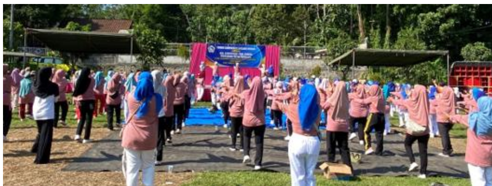
Gambar 3. Foto Kegiatan Pengabdian Masyarakat

dalam mengutarakan kendala yang dihadapi dalam aktivitas harian. Keberhasilan metode ini tercermin dari keaktifan lansia dalam mengajukan pertanyaan yang relevan, yang secara teoretis berperan penting dalam meningkatkan pemahaman serta keterampilan mereka untuk menjaga fungsi fungsional secara mandiri (Jones et al., 2023).