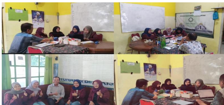
Gambar 7. Dokumentasi Pelaksanaan Pengabdian pada Yayasan Insan Muria Bakti Pertiwi

Berdasarkan hasil wawancara dan pengumpulan data yang dilakukan pada Yayasan Insan Muria Bakti Pertiwi Kudus, diketahui bahwa pencatatan keuangan yang selama ini diterapkan masih berupa catatan kas masuk dan kas keluar. Catatan tersebut digunakan sebagai bentuk pertanggungjawaban pengurus yayasan kepada para donatur, namun belum disusun sesuai dengan penyajian laporan keuangan entitas berorientasi nonlaba. Selain itu, yayasan belum melakukan pengelompokan pendapatan dan beban berdasarkan adanya pembatasan dari pemberi sumber daya, sehingga informasi keuangan yang disajikan masih terbatas dan belum mencerminkan kondisi keuangan yayasan secara menyeluruh.